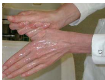
5: Frotar en forma rotatoria el pulgar derecho en la palma