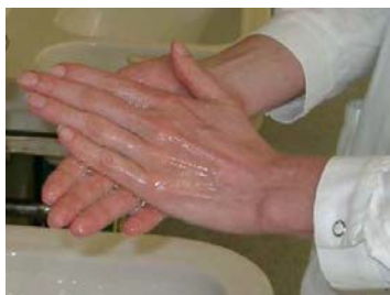
1: Palma contra Palma

Desde 1998 existe un estándar Europeo que regula la testificación de los desinfectantes de mano y estipula como debe llevarse a cabo la desinfección de las manos (EN 1500). Las figuras abajo muestran el procedimiento correcto, que indica el estándar. El estándar en cuestión es un estándar test , es decir que otras técnicas también son posibles, lo importante es que todas las superficies de la mano se humedezcan con el desinfectante