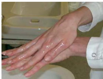
2. Palma derecha sobre dorso izquierdo y Palma izquierda sobre dorso de mano derecha