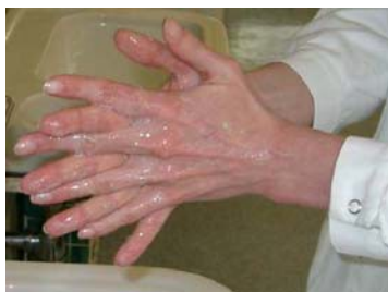
3: Palma con Palma con los dedos entrelazados